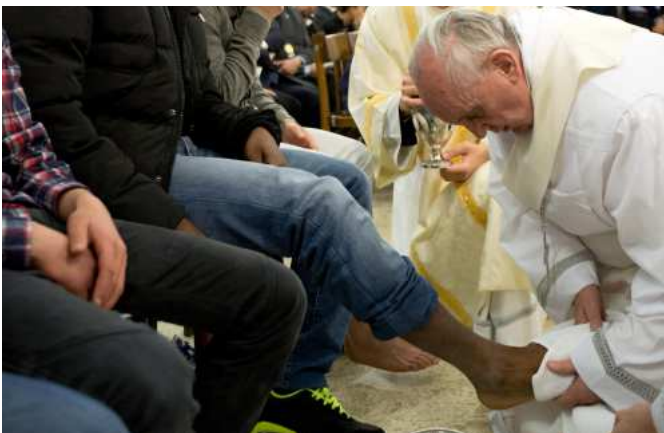
11. 2013 március 28. – A római Casal del Marmo fiatalok börtönében, Ferenc pápa 12 különböző nemzetiségű és vallású fiatal elítéltnak megmosta a lábát, közöttük két lánynak is. Egyikük katolikus olasz, a másik Rómában született roma származású lány volt és muzulmán.