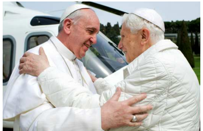
10. 2013. március 23. – „Testvérek vagyunk” - Ferenc pápa Castel Gandolfo-ban meglátogatja elődjét, a nyugalmazott XVI. Benedeket.