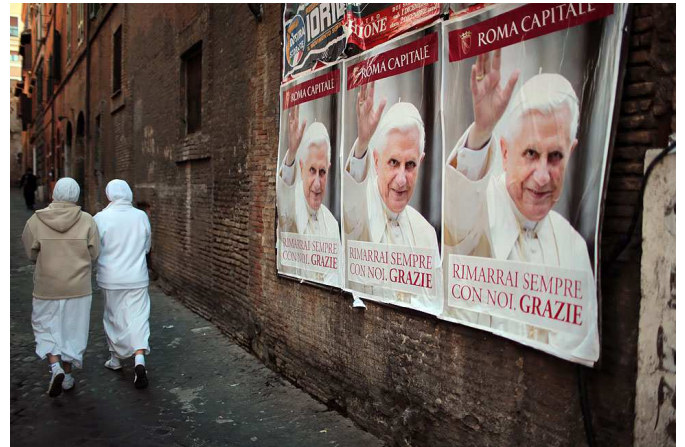
4. 2013. február vége – „Velünk maradsz örökre. Köszönjük.” Plakát Vatikán és Róma utcáin.