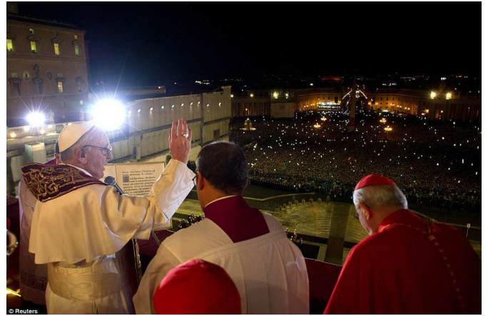
8. 2013 március 13 – Ferenc pápa megáldja a Szent Péter téren összegyűlt tömeget.