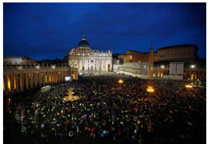
6. 2013 március 13. – Még nincs pápa. Várakozók sokasága a római Szent Péter téren a konklávé ideje alatt.