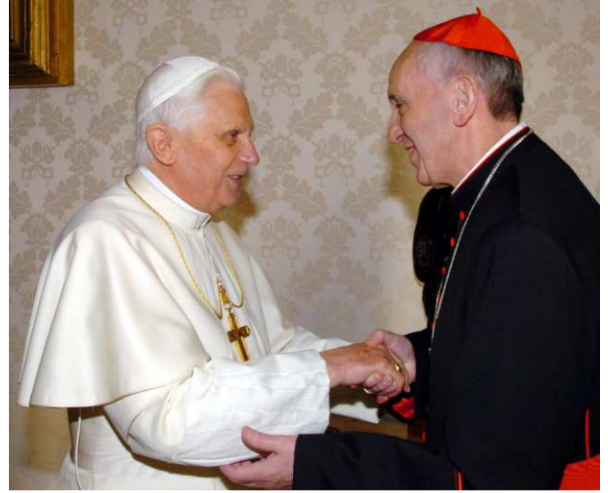
2. 2007. január 13. – XVI. Benedek pápa találkozája Jorge Mario Bergoglio bíborossal, Buenos Aires érsekével a Vatikánban.