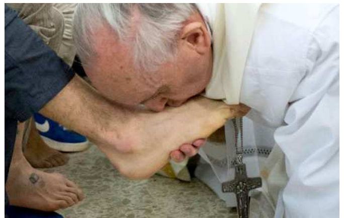
12. 2013. március 28. – "Ez Jézus kezének érintése" - mondta a földön térdelő pápa a fiataloknak, mielőtt kézbe vette, megmosta, megszáritotta és megcsókolta a lábukat. Ez volt az első alkalom, hogy a római pápa nőnek mosta meg a lábát.