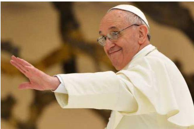
9. 2013. március 16. – Ferenc pápa az újságírókat köszönti a VI.Pál teremben, a mintegy 6000 újságíróval való találkozás során.