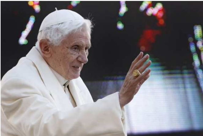
3. 2013. február 27.– XVI. Benedek pápa a híveket köszönti utolsó, általános kihallgatásán, a római Szent Péter téren.