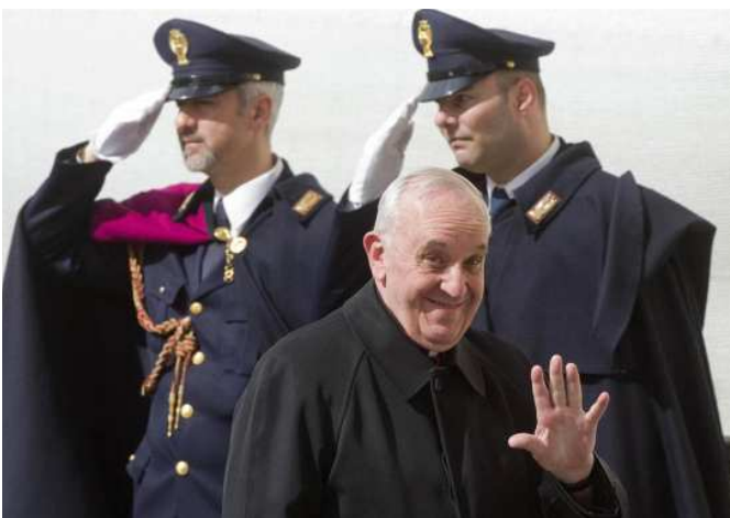
5. 2013. március 11. – Bergoglio bíboros, Buenos Aires érseke elhagyja a bíborosok X. kongregációjának gyűléstermét. Ez volt a bíborosok utolsó megbeszélése a pápaválasztó konklávé előtt.