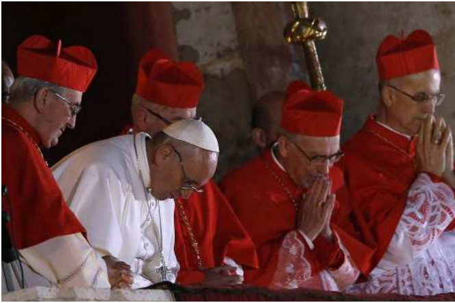
7. 2013. március 13. – 20 óra 21 perc. Az újonnan megválasztott Ferenc pápa először jelenik meg a Szent Péter bazilika erkélyén és mielőtt áldást adott volna, ő kérte maga számára a megáldandók imáját és mélyen meghajolt feléjük.