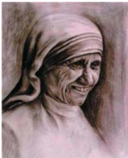
Etli Éva festménye