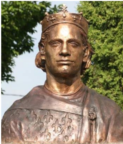
Lantos Györgyi szobrászművész alkotása, Görgényszentimre