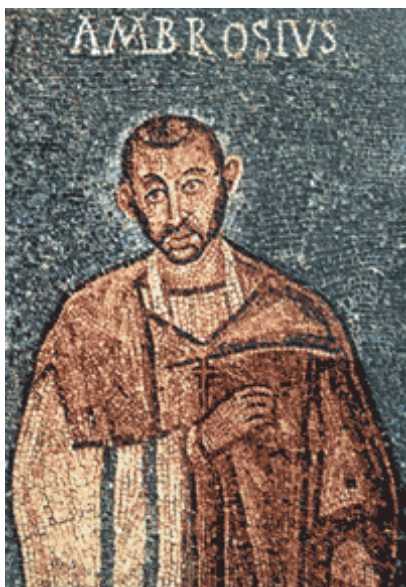
Mozaik a milánói Szent Ambrus Bazilikából

Ambrus előkelő római családból származott. 334 körül Trierben született, ahol apja előkelő állást töltött be. Atyja korai halála után édesanya három gyermekével visszatért Rómába. Ambrus, aki rétori* és jogtudományi képzésben részesült, már 370-ben Milánó székhellyel Liguria és Aemilia tartományok kormányzója lett. Amikor meghalt Milánó ariánus püspöke, Auxentius, Ambrus még csak katekumen** volt. Az utód megválasztása nem ment könnyen, a város népe pártokra szakadt. Ambrus, mint ezt a hivatala kívánta, közvetítőként lépett fel, amikor hirtelen, mintegy felsőbb akarattól vezetve mindkét párt püspökké választotta. Nyolc nap múlva megkeresztelkedett, s 373 dec. 7-én püspökké szentelték. Ambrus, bár vonakodott elfogadni a tisztét, teljes szívvel törekedett azt betölteni. Mint egyházi szónok rendkívüli sikereket ért el.