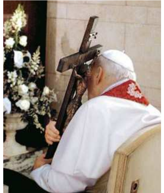
Az egyik utolsó fénykép

át, nadrágban és dzsekiben. Mind közül azonban az egyik utolsó fénykép a legkedvesebb számomra. 2005 nagypéntekén már a magánkápolnájából követte a colosseumi keresztutat. Egy keresztet kért, ráhajtotta a fejét a korpuszra, és a szívéhez szorította. Ebben a mozdulatában minden benne volt.”